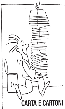
CARTA E CARTONI