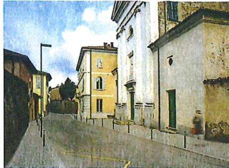
IMMAGINE AGGRANDITA ANTISTANTE LA CHIESA DI S. VITALE