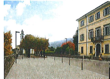
IMMAGINE VERSO SAN ROCCO E CASA M. DESE